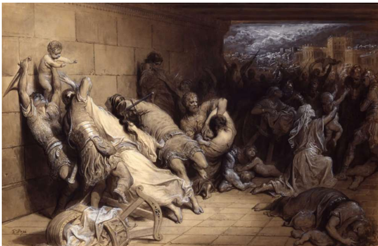
Gustave Doré — La matanza de los inocentes