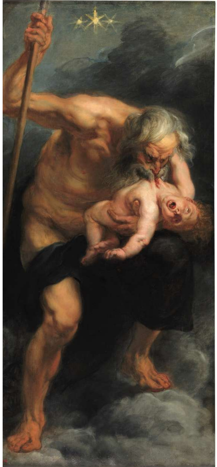
Saturno devorando a un hijo 1636 - 1638. Óleo sobre lienzo Pedro Pablo Rubens