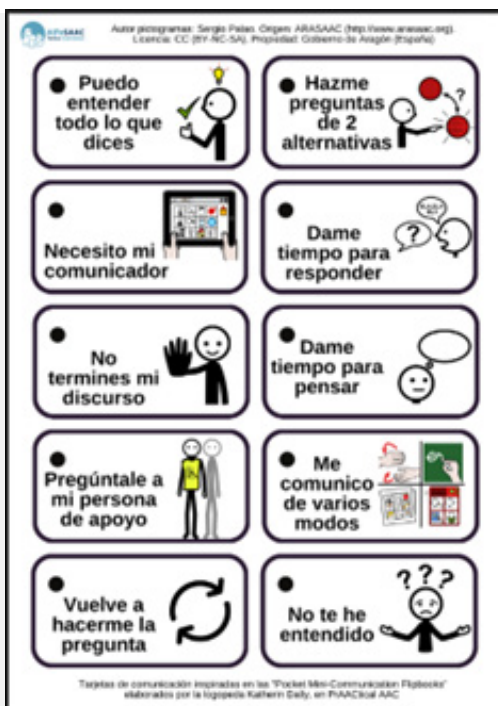
Imagen 1: Frases con apoyo pictográfico para imprimir en tamaño tarjetas y ser utilizadas como llavero.

En la guía se aborda, de manera práctica, los diferentes tipos de apoyos a personas que usan o necesitan modos de expresión alternativos al habla, así como las estrategias que deben desplegar los interlocutores e ideas para preparar las entrevistas (con un notario, para las medidas de apoyo voluntarias, por ejemplo), bien la preparación de comparecencias en despachos o juzgados.