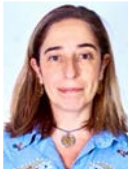
ELENA CABERO MONTERO

Magistrada de la Audiencia Provincial de Alava