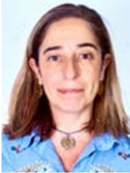
ELENA CABERO MONTERO

Magistrada titular integrante de la sección 2ª de la Audiencia Provincial de ÁLAVA