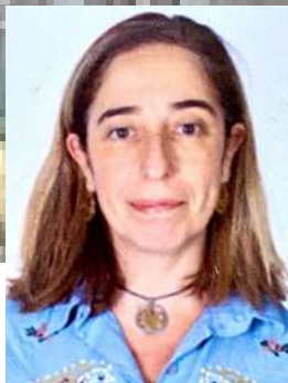
ELENA CABERO MONTERO

Magistrada titular integrante de la sección 2ª de la Audiencia Provincial de ÁLAVA