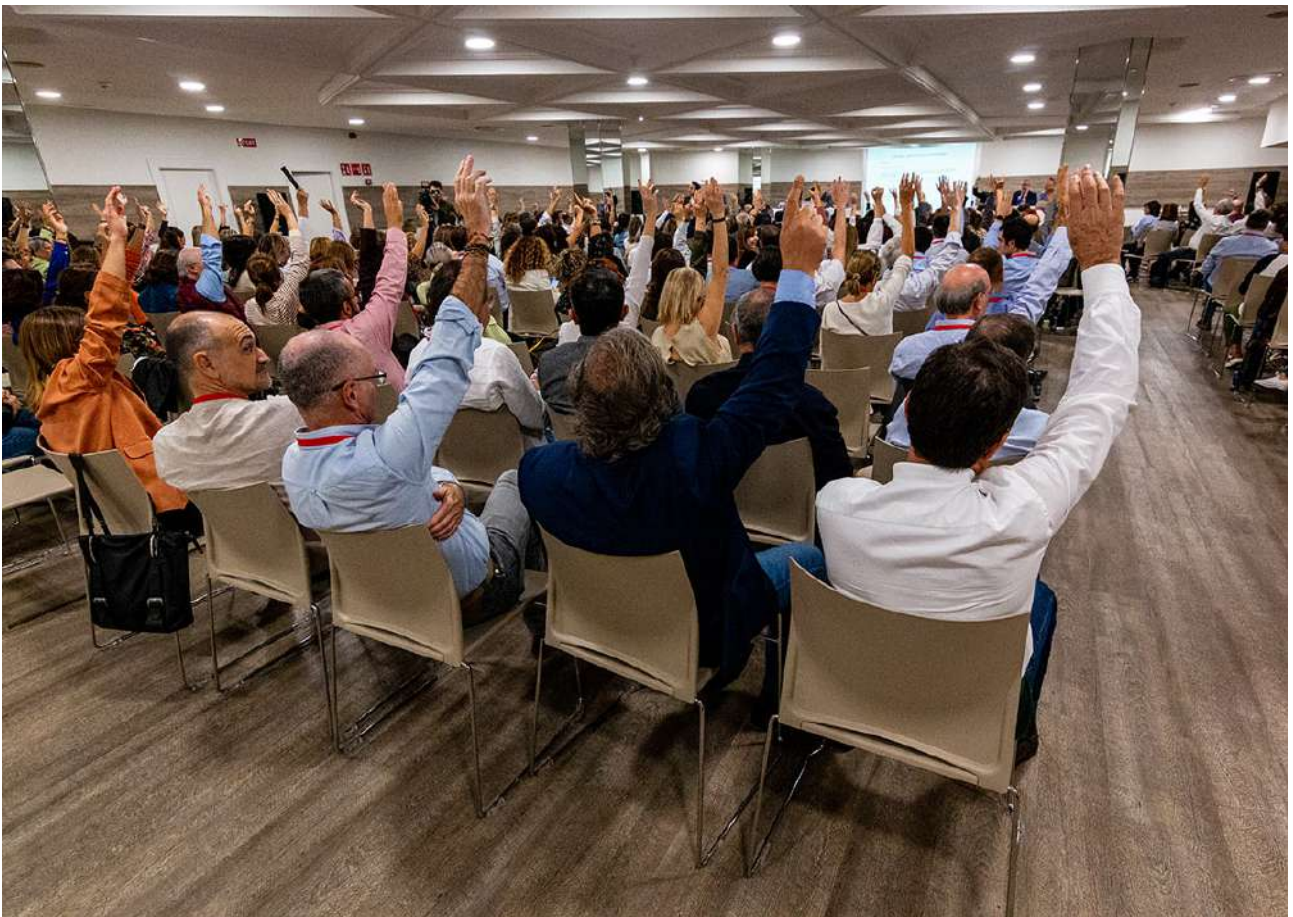
Los asistentes a la Asamblea anual de la AJFV rechazan las declaraciones de la ministra de Igualdad, Irene Montero, y de su delegada del Gobierno contra la violencia de género, la magistrada en servicios especiales, Victoria Rosell, quienes criticaron duramente la aplicación de la ley del "solo si es sí" con resultados contrarios a los que se esperaba.

Y el futuro, ya casi presente, hará que este ser con vida propia llamado AJFV nos siga deparando nuevos retos e ilusiones en búsqueda de que cada día estemos más y más cerca de alcanzar una justicia independiente realmente dotada de medios que permitan ofrecer a cualquier ciudadano que lo precise un servicio público en la materia de verdadera calidad, pero a precio no de saldo sino ajustado a lo que debe ser un irrenunciable modelo de Administración propio del siglo XXI.