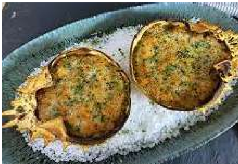
TXANGURRO A LA DONOSTIARRA

Pensar en Getaria, a nivel gastronómico, es pensar en uno de los templos del producto nacional y una de las parrillas más famosas del mundo, la del restaurante "Elkano", dotado con una estrella Michelin y que ocupa el puesto número 16 del mundo dentro de la lista "50 best". Su plato estrella es un inconmensurable rodaballo a la parrilla.