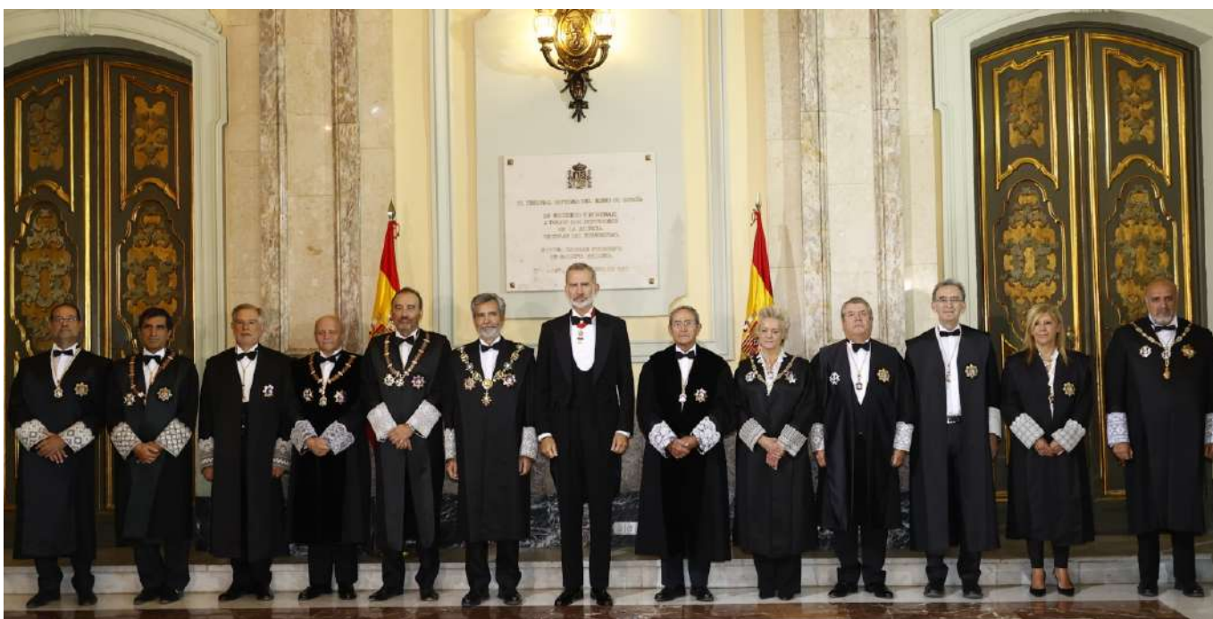
Fotografía de grupo de Su Majestad el Rey con los miembros de la Sala de Gobierno del Tribunal Supremo Palacio de Justicia. Madrid, 07.09.2022

La falta de renovación del Consejo General del Poder Judicial, tras más de cuatro años, y la prohibición al actual de efectuar nuevos nombramientos, perpetúa la foto fija de esta ignominiosa e injustificada desigualdad de la presencia de las mujeres en los altos cargos de la magistratura española. Los datos son concluyentes: subsiste, en quienes nombran, una cultura heredada subconsciente que invisibiliza y minusvalora a las mujeres para ejercer puestos de poder, que mira con recelo la ambición femenina y como cualidad la del varón.